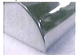
こんなにきれいに！

この他にも弊社には、下記の研磨設備があり、経験豊富な社員の手によってステンレス製品に磨きをかけています！