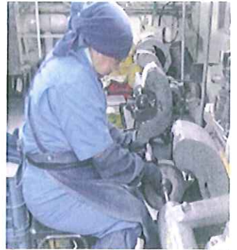
バフ研磨作業の様子

弊社では、前身の「洋食器製造」時代から受け継いでいる 熟練の研磨技術 を生かし、弊社の主力である ステンレス製品 の 美しさ を引き出す様々な表面処理加工を行っております！