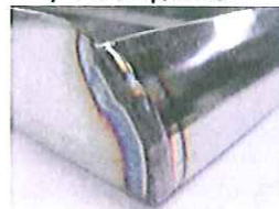
溶接あとも・・・