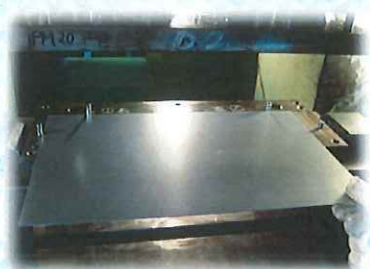
②材料 ボンデ(鉄) 厚さ 0.8mm をセット★