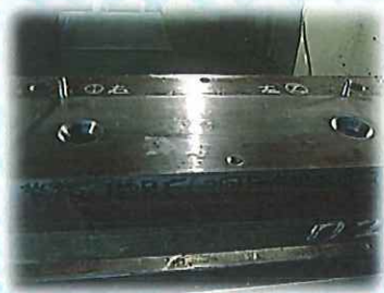
①金型のダイをセット★